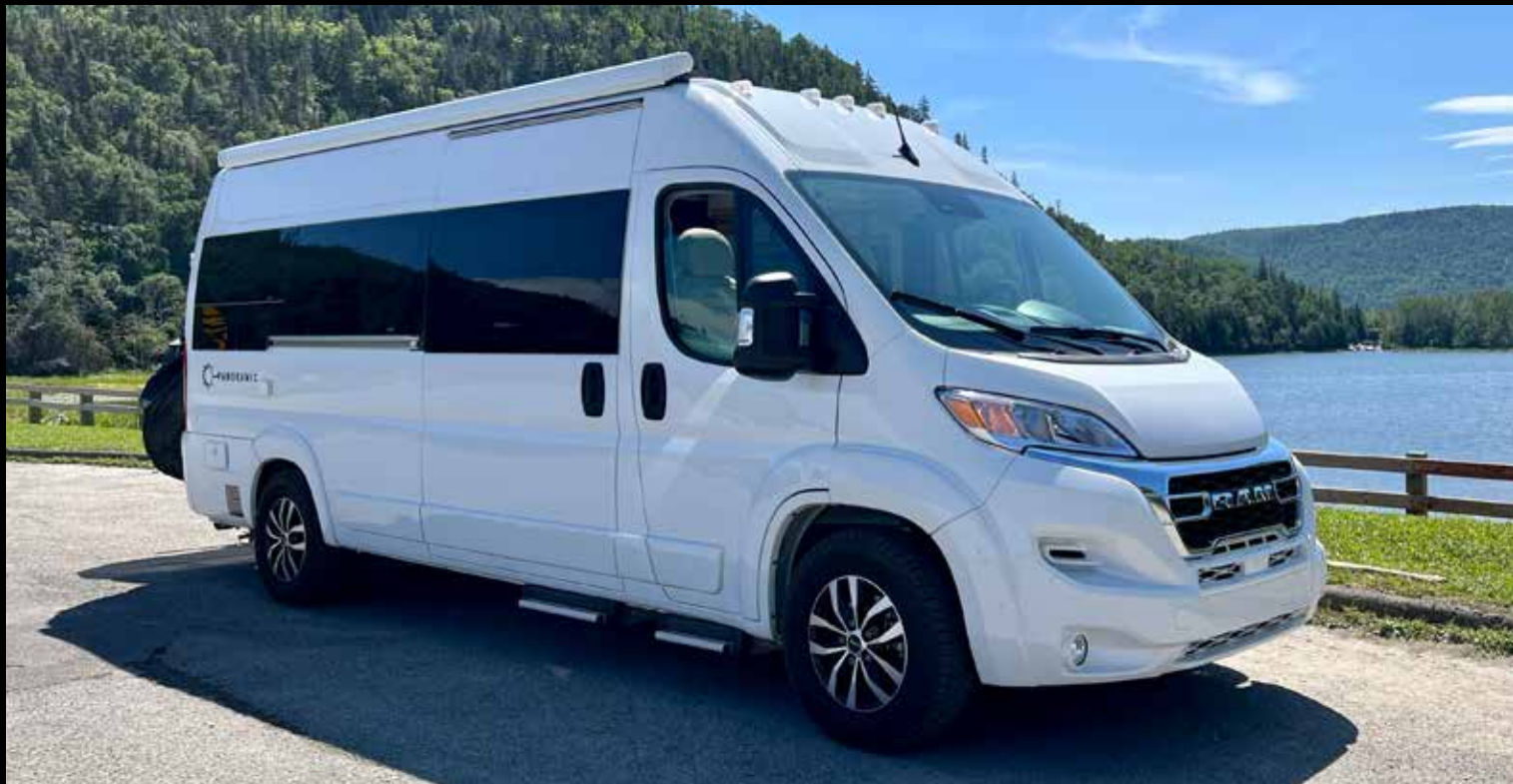
RAM Promaster 3500, Pentastar 3.6 L, 280CV